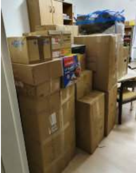
Pakete für Kiew