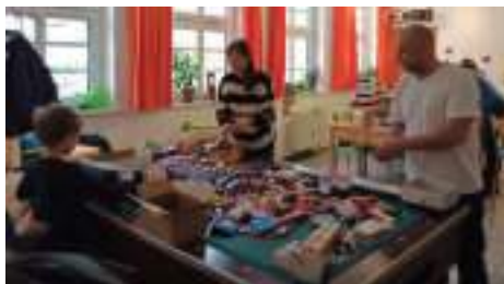
Geschenke für ukrainische Kinder werden verpackt

Auch die Nächstenliebe kam nicht zu kurz, denn es wurden viele Geschenke für Kinder in der Ukraine verpackt. Ein Billardtisch voller Süßigkeiten wurde bestaunt und dabei nicht versucht, die eigenen Bäuche zu füllen, sondern Allen war klar: Diese Süßigkeiten sind Geschenke.