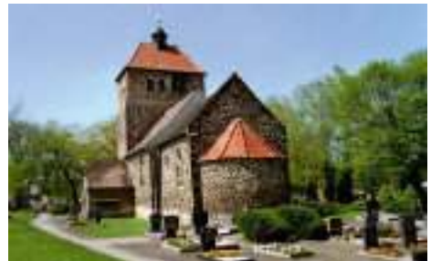
ev. Kirche in Mühlbeck