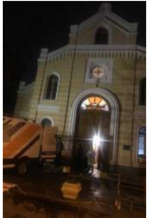
Pakete für Kiew

Ein herzliches Dankeschön an alle, die geholfen haben, dass diese Aktion zu einem guten Ende gekommen ist und ebenso an alle, die durch ihre Großzügigkeit das erst möglich gemacht haben.