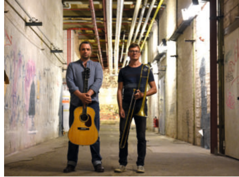
Duo „Mehr als wir“

Sie singen gern? Der Frieden in unseren Städten und Dörfern, im Land und der Welt liegt Ihnen am Herzen? Sie haben eine halbe Stunde Zeit im Monat? Dann sind Sie richtig an jedem 24. des Monats auf dem Markt zu Wolfen-Nord . Unser gemeinsames Singen beginnt immer 16.30 Uhr .