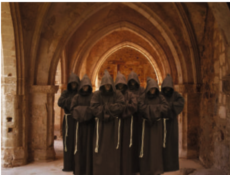
The Gregorian Voices https://www.muhsik.com/

Gregorian Voices Stadtkirche Bitterfeld Tickets bei Buchhandlung Krommer oder online z.B. unter www.adtticket.de