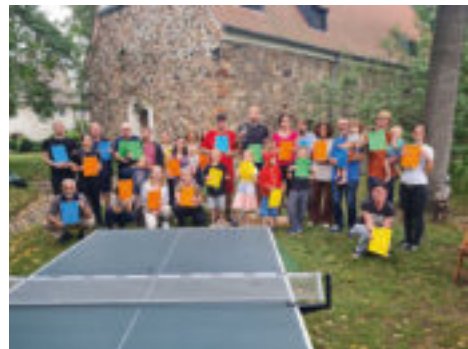
Gruppenbild vom Turnier 2022